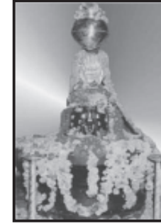
શ્રી ભુવનેશ્વર મહાદેવ ગાંધીનગર