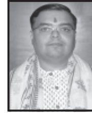
અધ્યક્ષશ્રી ડૉ. રવિદર્શનજી