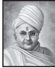
ડૉ. પૂ. આચાર્યશ્રી ચરણતીર્થ મહારાજ