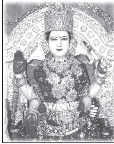
॥ મા ભુવનેશ્વરી ॥