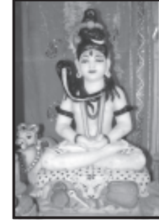
શ્રી ભુવનેશ્વર મહાદેવ