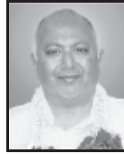
પૂ. આચાર્યશ્રી ઘનશ્યામજી મહારાજ